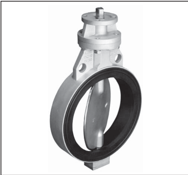
Bild 1 - Absperrklappe BR 17z